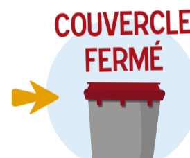
POUBELLE ORDURES MÉNAGÈRES

CES DÉCHETS NE DOIVENT PAS ÊTRE JETÉS DANS LA POUBELLE À COUVERCLE JAUNE (DÉCHETS RECYCLABLES).