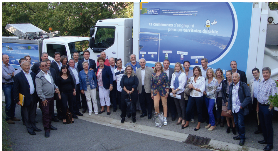
Les élus communautaires s'engagent pour un territoire durable.