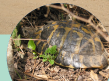
Une tortue d'Hermann au réveil, au printemps