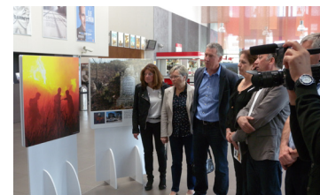
La culture du risque est marquée sur le territoire. Ci-dessus, lors de l'exposition tout public coorganisée par la Communauté de communes «Pour la forêt, mon cœur sans flamme» au Carré GAUMONT de Sainte-Maxime en avril 2016