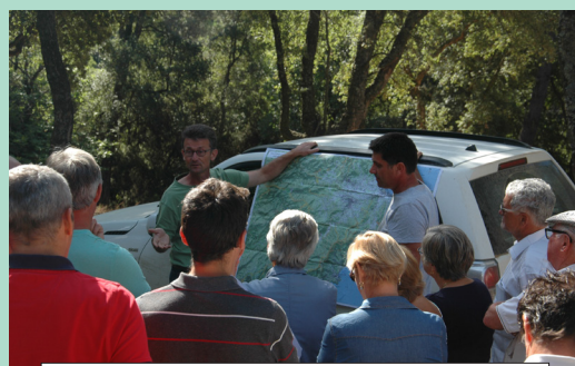
Les deux responsables du service Forêt ont expliqué le rôle des chantiers forestiers