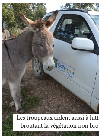
Les troupeaux aident aussi à lutter contre le feu : en broutant la végétation non broyée par les engins