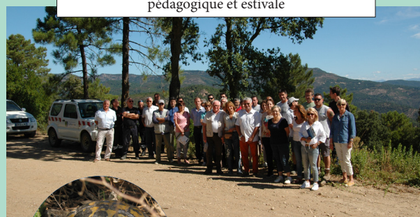
Une trentaine de participants a profité de la visite pédagogique et estivale