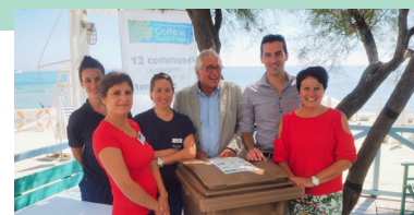
L'équipe du Pôle Déchets Ménagers et Assimilés

La sensibilisation des habitants – professionnels et ménages – ainsi que des touristes est au cours des enjeux locaux. Sur la plage de la Nartelle à Sainte-Maxime, elle s'est donc tout logiquement retrouvée dans l'air du temps estival. Un territoire Zéro déchet d'ici 2030 ? Le mercredi 12 juillet, la Communauté de communes et la Région ont lancé le pari d'y arriver. Via une journée ludique sur le sable autour d'ateliers pédagogiques pour petits et grands, de jeux interactifs pour mieux connaître les pratiques éco-vertueuses, ou encore d'ateliers de réalité virtuelle, le public a pu (ré)apprendre à mieux gérer les déchets.