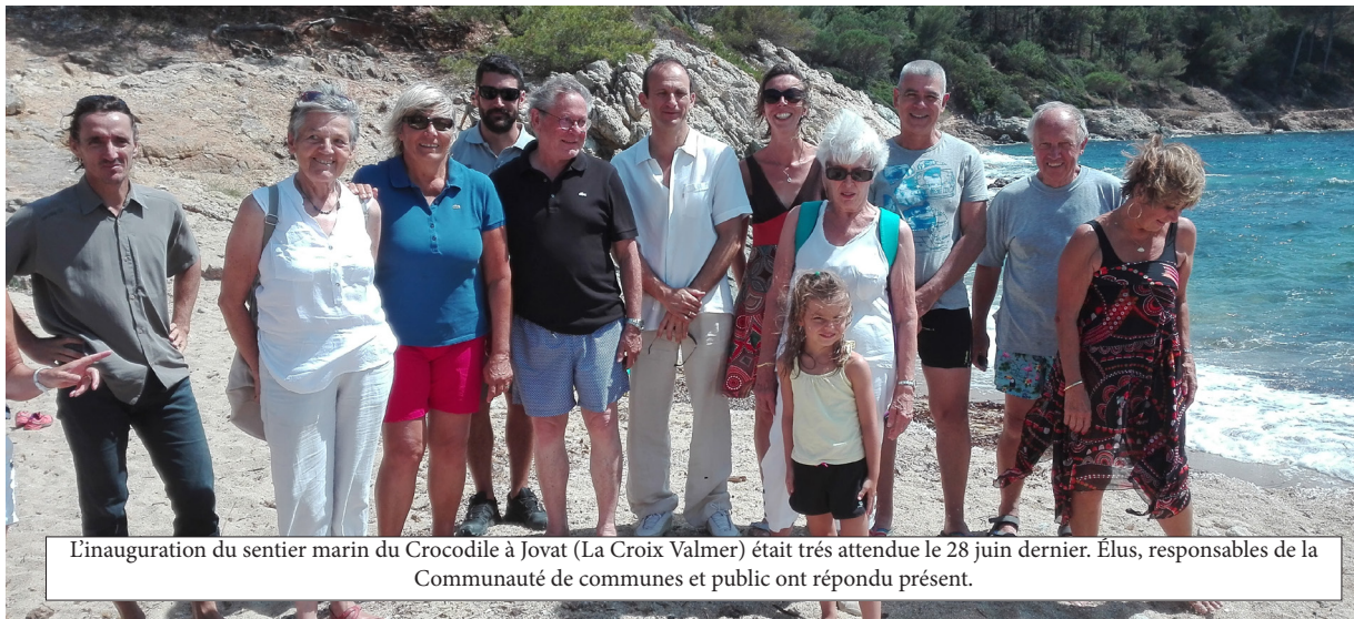
L'inauguration du sentier marin du Crocodile à Jovat (La Croix Valmer) était très attendue le 28 juin dernier. Élus, responsables de la Communauté de communes et public ont répondu présent.

Conseiller Régional Provence-Alpes-Côte d'Azur