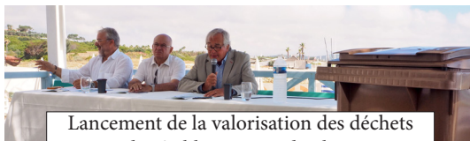
Lancement de la valorisation des déchets des établissements de plage

Plus que jamais, pour dessiner le Golfe de Saint-Tropez à l'horizon 2030, vous avez un rôle à jouer !