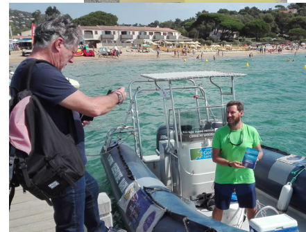
Un des panneaux du sentier marin (en haut) et la campagne Écogestes