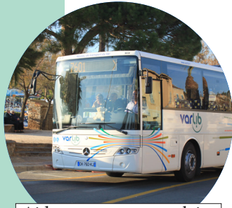
Aide au transport scolaire

Cavalaire-sur-Mer : 492 élèves Cogolin : 426 élèves Gassin : 134 élèves Grimaud : 254 élèves La Croix Valmer : 257 élèves La Garde-Freinet : 128 élèves La Mole : 122 élèves La Plan-De-La-Tour : 266 élèves Ramatuelle : 117 élèves Rayol-Canadel-sur-Mer : 51 élèves Sainte-Maxime : 828 élèves Saint-Tropez : 200 élèves