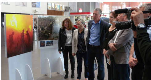
Inauguration de l'exposition sur le risque incendie le 23 avril