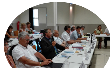
La délibération sur le projet de Marathon a été votée à l'unanimité le 19 juillet en Conseil Communautaire.