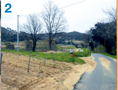
1-Formation de ravines 2-Ensablement en bas de parcelle