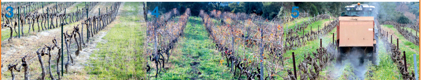
3-Enherbement par semis (un rang sur deux) 4-Enherbement naturel maîtrisé 5-Amendement par épandage de compost de déchets verts