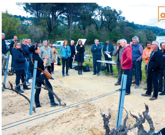
Démonstration de matériel agricole au Plan-de-la-Tour